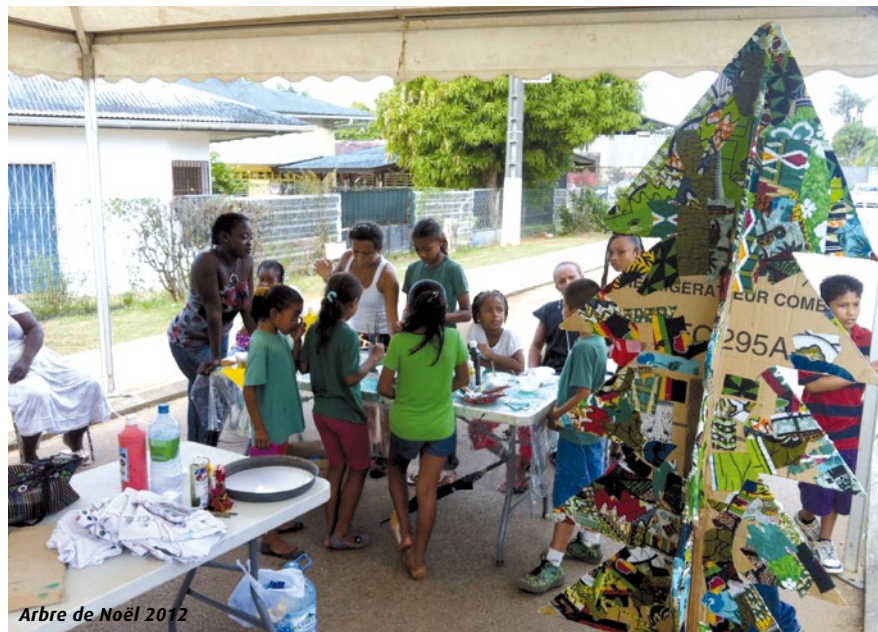
Arbre de Noël 2012

Le centre de loisirs Kikiwi met en place une série d'activités pour les enfants durant les petites et grandes vacances.