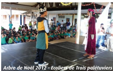
Arbre de Noël 2012 - Ecoliers de Trois palétuviers

L'aide sociale est possible grâce aux différents dispositifs de solidarité active mis en place par la municipalité, en faveur notamment des jeunes qui représentent plus de la moitié de la population de Saint-Georges.