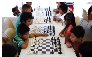
Bilan positif pour les activités périscolaires et de loisirs destinées aux plus jeunes tous les mercredis et durant les périodes de vacances scolaires.