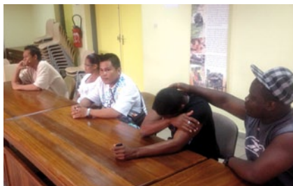
Les jeunes et les représentants des associations invités à la réflexion.