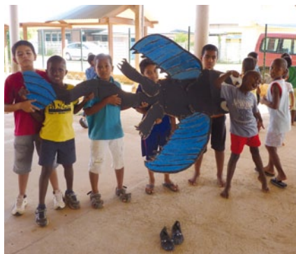
Activités artistiques, pédagogiques et ludiques aux programmes des enfants