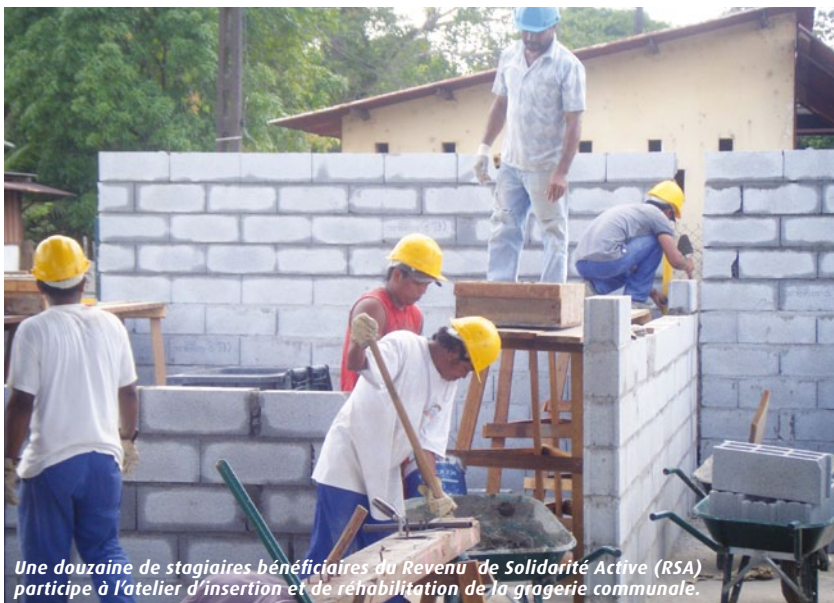
Une douzaine de stagiaires bénéficiaires du Revenu de Solidarité Active (RSA) participe à l'atelier d'insertion et de réhabilitation de la gagerie communale.

Pour différentes raisons, certaines personnes ou familles se retrouvent dans des situations qui les fragilisent de façon temporaire ou sont durablement touchées par les aléas de la vie.