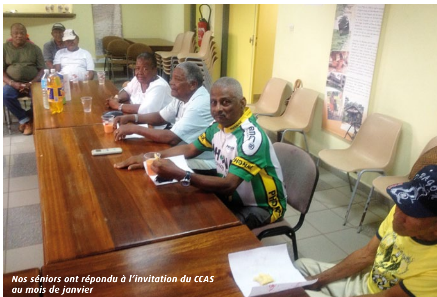
Nos séniors ont répondu à l'invitation du CCAS au mois de janvier