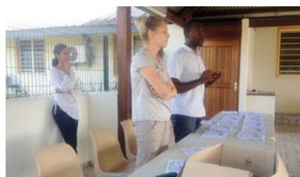
Réunion d'information sur les emplois d'aide à la personnes organisée par la Mission locale en partenariat avec le CCAS

Le chantier qui a débuté au mois d'août 2012 devrait s'achever au mois de juillet prochain. Durant toute cette période proposée par le CCAS, la douzaine de stagiaires a pu bénéficier d'un accompagnement individuel et collectif (tutorat, méthodes de recherche d'emploi, bilan de compétences...) mis en place par les différents partenaires du projet. Cette immersion sur le terrain permet aux candidats de renouer avec une activité, reprendre confiance en eux et définir un véritable projet professionnel.